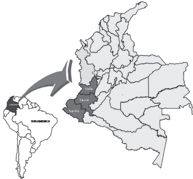
Figura 1. MAPA DEL SUROCCIDENTE COLOMBIANO.

Las minorías étnicas en el suroccidente de Colombia se encuentran diseminadas por un territorio que comprende tres departamentos (Valle, Cauca y Nariño) 6 desde la Costa del Pacífico hasta la vertiente occidental de la Cordillera Central. A pesar del gran tamaño del área ocupada por comunidades indígenas, negras y campesinas, muchos de estos territorios en la actualidad se encuentran en áreas asociadas a zonas de reserva forestal, parques nacionales naturales, áreas de conservación estratégica como páramos y humedales, sin contar con aquellas zonas donde se han implementado - O en su defecto se piensan implementar - grandes proyectos de explotación minera, o construcción de infraestructura energética, vial o portuaria. Un ejemplo de ello es el interés que existe entre diversos sectores políticos del Cauca por dar apertura a una vía al mar y habilitar la navegación hacia los puertos fluviales de Guapi y Saija, así como también la reactivación de proyectos como la central hidroeléctrica de Brazo Seco que operaría buena parte de la interconexión energética del pacífico caucano y nariñense.