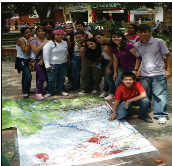
Figura 5. Jóvenes participantes del proyecto Sabaneta desde los sentidos frente al resultado del mapa que representa el contexto territorial del municipio de Sabaneta.

Además este proyecto representó para muchos de los jóvenes participantes una alternativa, (y a veces la única opción) para ocupar su tiempo libre. Una oferta que no habían tenido la posibilidad de vivir, hasta ahora, los jóvenes de Sabaneta y en la cual aprendieron a estimar con el corazón y la razón su ciudad, promoviendo así, la construcción de una cultura ciudadana, al ser jóvenes que luego de vivir esta experiencia, comenzaron a valorar su entorno, porque aprendieron a conocerlo, el cual antes ignoraban o desconocían porque lastimosamente el sistema educativo va por un lado como aislado de la realidad, ignorándola, mientras que por otro lado continua el día a día de la vida cotidiana local sin que aún sea incorporada en los procesos educativos formales.