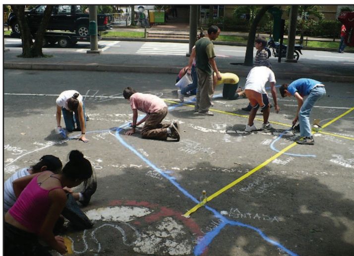
Figura 3. Elaboración del mapeo de la región central antioqueña.

Momentos pedagógicos de gran impacto, donde se desplegaban creativamente diferentes técnicas y lenguajes de representación de la percepción territorial, en escenarios públicos donde se participaba abiertamente a toda la ciudadanía para que conociera los alcances y desarrollos de las habilidades y aprendizajes obtenidos por los participantes.