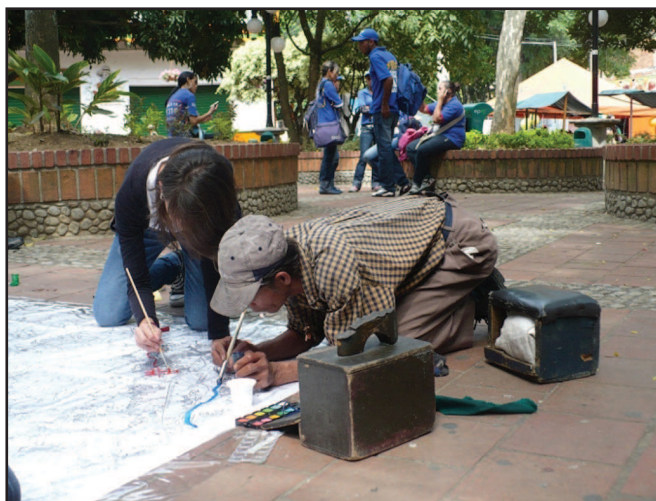
Figura 4. Jóvenes del proyecto Sabaneta desde los Sentidos y ciudadanos del común participando en un taller de representación cartográfica del territorio local.

Aportar al cambio de actitud frente a su entorno y promover una nueva cultura del territorio, fue uno de los logros gracias al trabajo de experimentación asumido por los participantes. En el año 2009, las investigaciones del hábitat local emprendidas por ellos, procuraron hacer comprensible y promover la interacción de saberes, disciplinas y procedimientos lógicos como guía en la construcción del conocimiento local. Combinó enfoques y perspectivas del método de investigación cualitativo con un método de estudios del territorio y el paisaje para ofrecer propuestas de tratamiento analítico, organización de la información, presentación de resultados y formulación de perfiles de gestión. Desde la idea del proyecto de investigación hasta la investigación en sí, como ejecutoria de índole grupal y personal, la experiencia de este proceso buscó integrar pobladores y reflexiones sobre el hábitat local; enriquecer miradas, lenguajes y maneras de percepción, y hacer de la comunicación, publicación y transmisión de estas ideas una manera de reconocer las identidades e imaginarios de la vida sabaneteña.