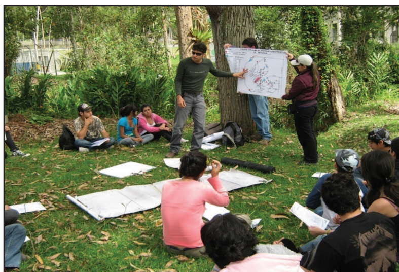
Figura 2. Jóvenes participantes de Sabaneta desde los Sentidos en salida de campo al oriente antioqueño escuchando una charla sobre las geografías hidráulicas del sistema hidroenergético de la región central del Antioquia.

Consistía en talleres presenciales en Aula, en donde el equipo facilitador impartía instrucción y daba las pautas y orientaciones básicas para abordar los proyectos de investigación propuestos y de percepción de lectura y análisis de la vida local, así como enfocar y construir conceptualmente las puestas en escena pública y los alcances de del trabajo en campo.