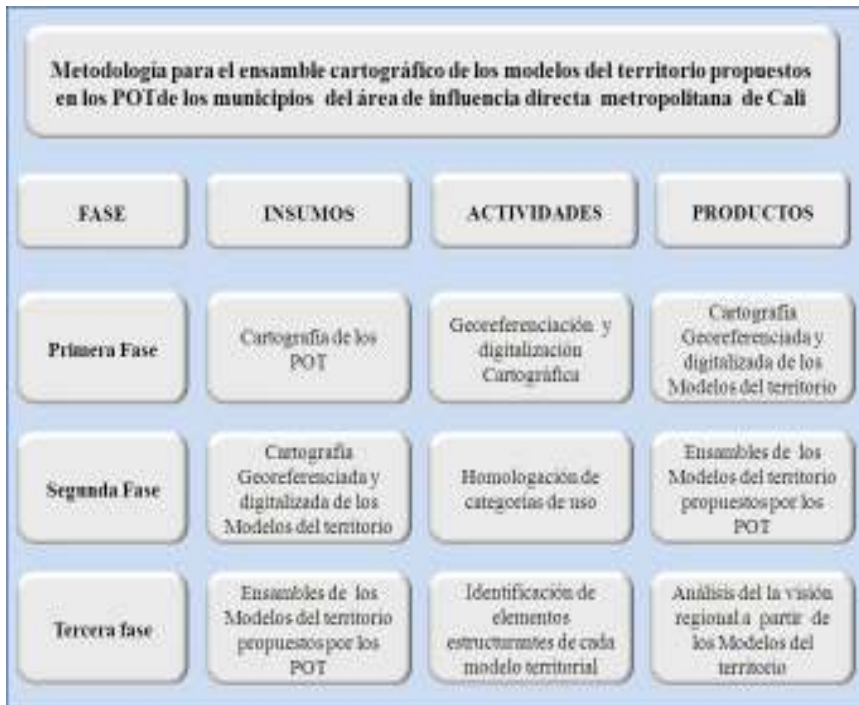
Figura2. Metodología para el ensamble cartográfico de los modelos del territorio propuesto.

al obtener los ensambles de los modelos del territorio se identificaron los elementos estructurantes regionales de cada modelo de ocupación territorial.