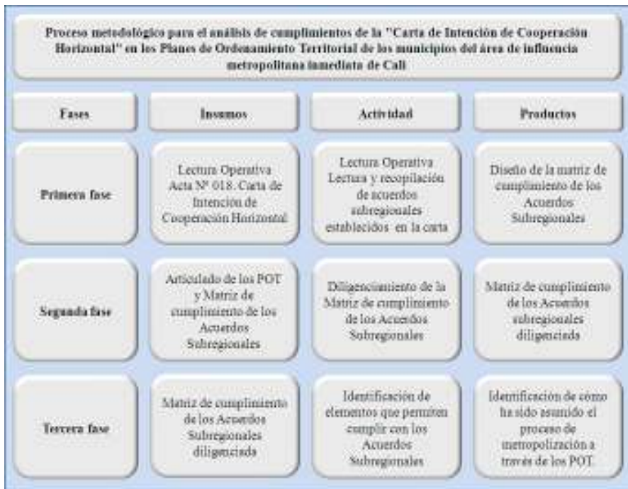
Figura 5. Proceso metodológico para el análisis de aceptación de compromisos de la “Carta de Cooperación Horizontal”.

En la figura 5 se muestra el proceso metodológico que se siguió para el estudio de aceptación de los lineamientos propuestos en la carta, el cual, está conformado por tres fases: en la primera, se realiza el diseño de la matriz de cumplimiento de los acuerdos subregionales teniendo en cuenta la lectura operativa y el acta N° 018 “Carta de Intención de Cooperación Horizontal”; en la segunda fase se realizó el diligenciamiento de la matriz y posteriormente con los resultados obtenidos se logró identificar como ha sido asumido el proceso de metropolización.