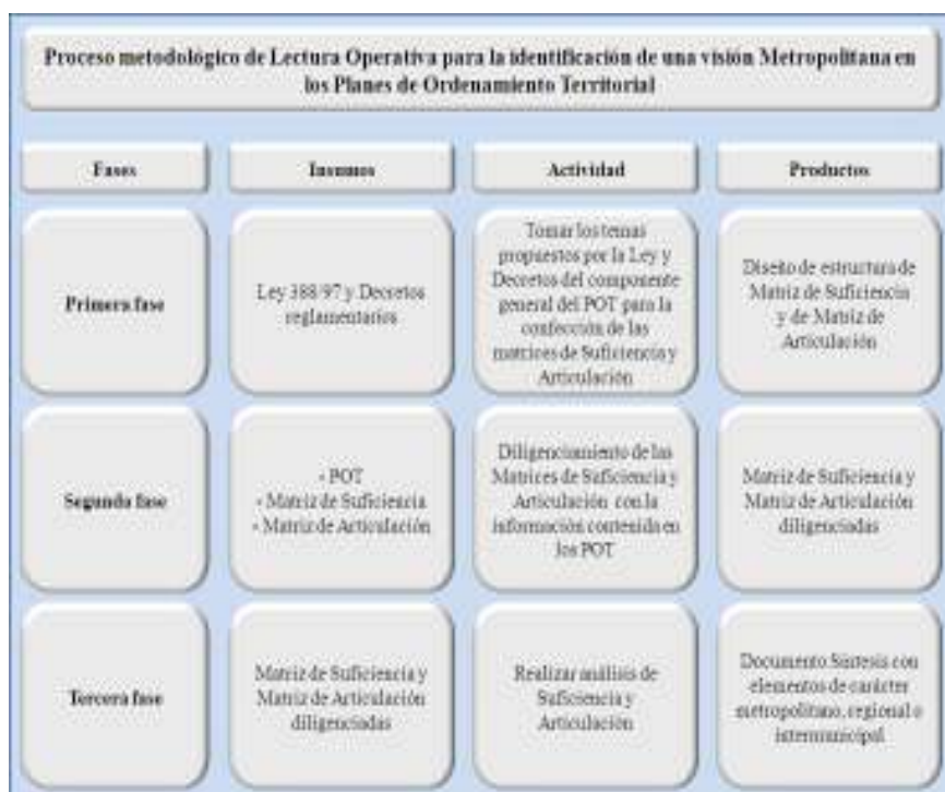
Figura 1. Proceso metodológico de lectura operativa para la identificación de una visión metropolitana en los Planes de Ordenamiento Territorial.

En la figura 1 se presenta la caracterización de cada uno de los análisis incluidos en la Lectura Operativa, para la identificación de las relaciones de tipo intermunicipales o regionales que permitan tener indicios de una visión metropolitana, el cual consta de tres fases: la primera, toma como insumo la ley 388/97 y su decreto reglamentario 879/98 para diseñar la estructura de las matrices; en la segunda, se realiza el diligenciamiento de las matrices con la información contenida en los POT, y en la tercera, se efectúa el análisis de suficiencia y articulación para identificar los elementos de carácter metropolitano, regional o intermunicipal.