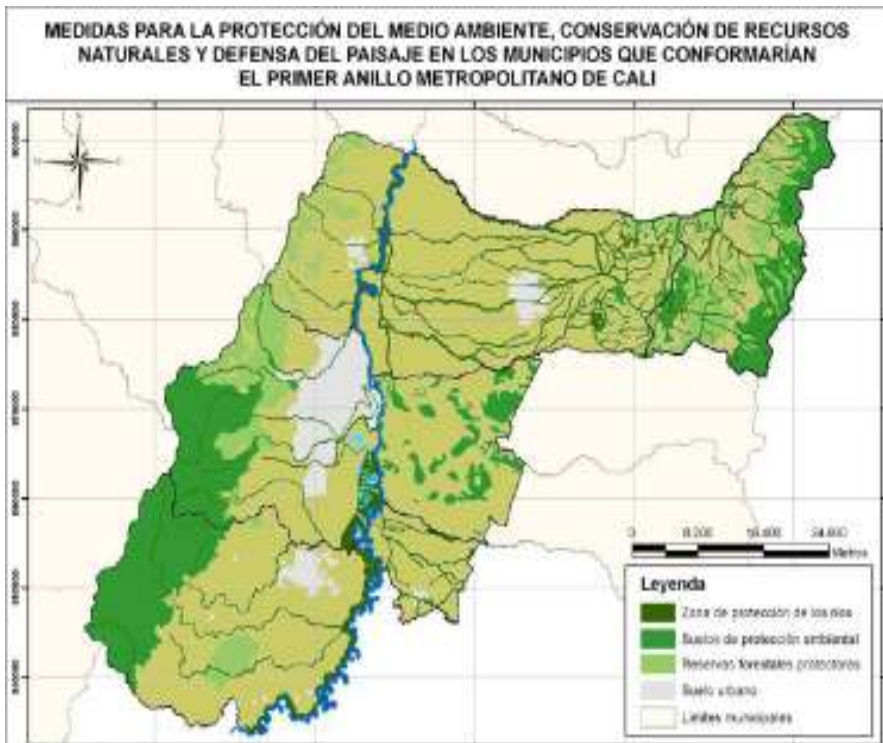
Figura 6. Medidas para la protección del medio ambiente, conservación de recursos naturales y defensa del paisaje en los municipios que conformarían el primer anillo metropolitano de Cali.