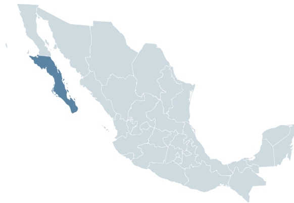
Figura 1. Ubicación del Baja California Sur dentro del territorio mexicano

Esta entidad federativa cuenta con una amplia extensión territorial, misma que le permite posicionarse como la novena entidad con mayor superficie (Instituto Nacional de Estadística y Geografía, 2020a) y se sitúa al noroeste de México, situado entre el Océano Pacífico y el Mar de Cortés como lo muestra la Figura 1.