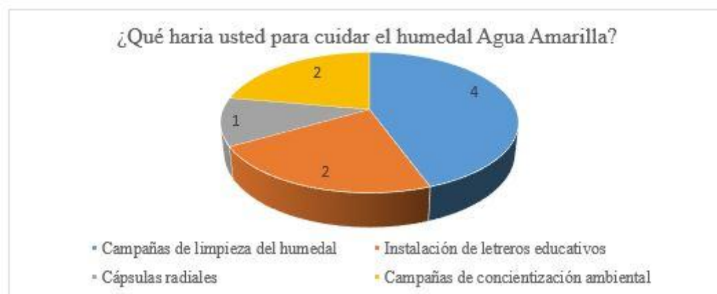
Figura 5. Iniciativas comunitarias para cuidar y proteger el humedal Agua Amarilla