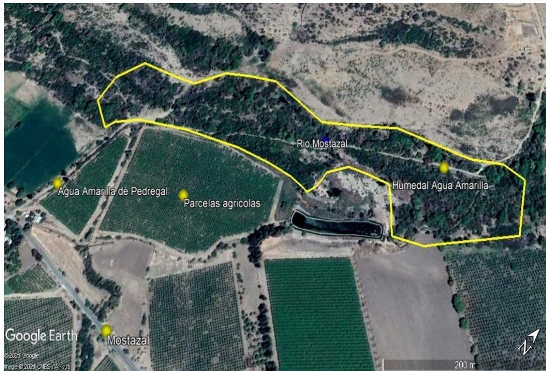
Figura 1. Mapa del Humedal Agua Amarilla

En la (Figura 1) se puede observar el humedal en el rio Mostazal y en sus alrededores el sector de Agua Amarilla de Pedregal, comuna de Monte Patria, provincia del Limarí, Región de Coquimbo, Chile.