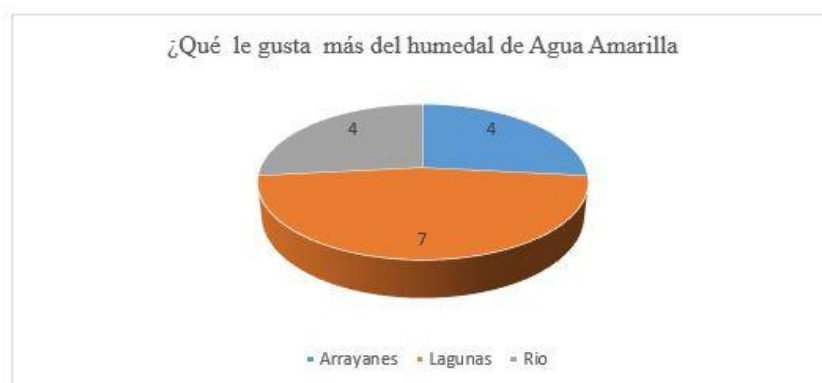
Figura 3. Elementos que más llaman la atención de las personas