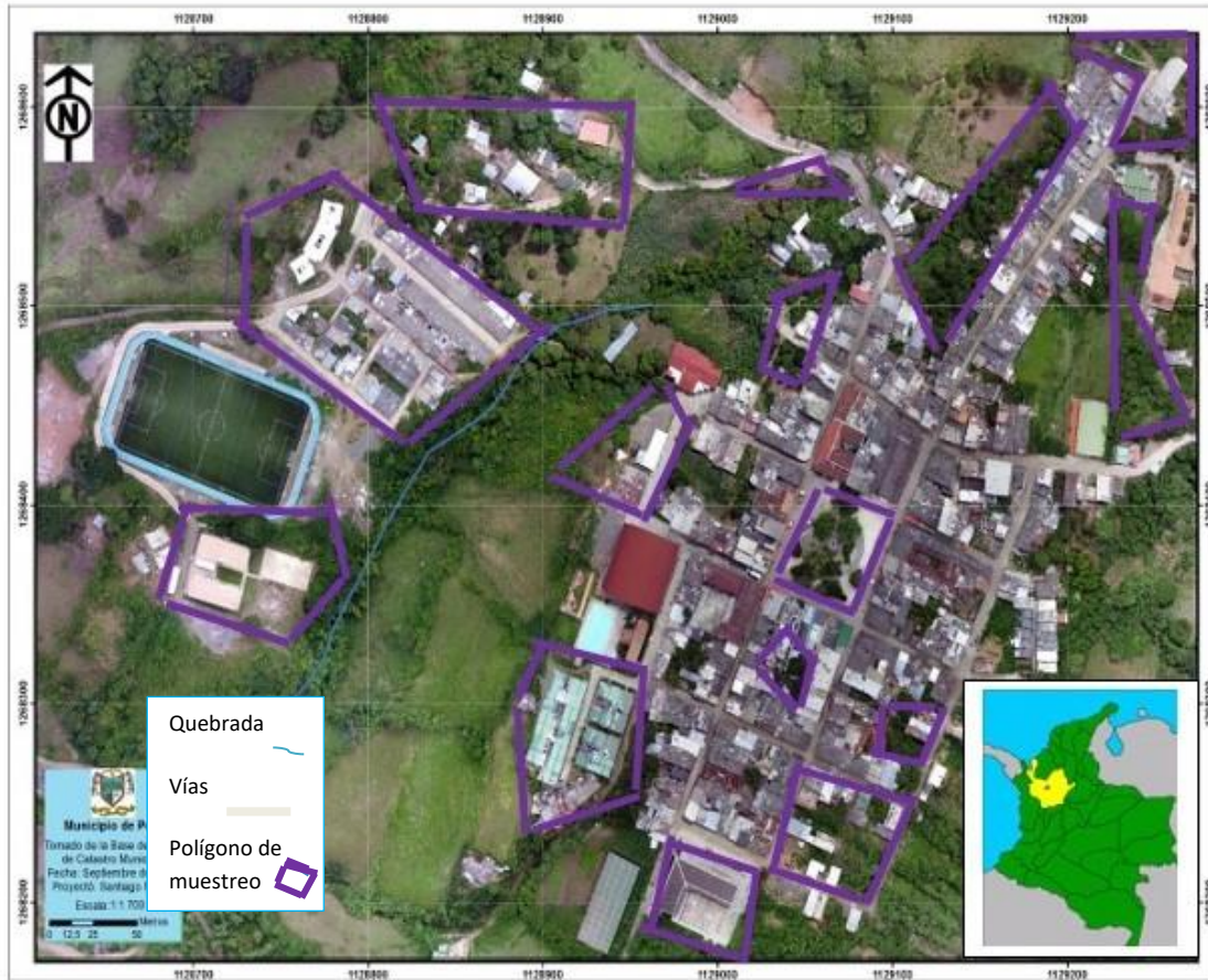
Figura 1. localización de la zona de estudio con su respectiva cobertura vegetal circundante y áreas de muestreo (Polígonos de color morado).